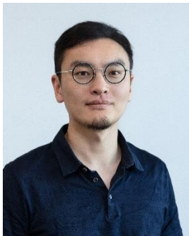
フランク・ワン (Frank WANG) 氏 DJI CEO 兼創業者

DFA デザインリーダーシップ賞は、戦略的で革新的なデザインを活用して、成功を生み出し持続可能なビジネスを創出した世界的ビジネスリーダーを表彰します。今年を受賞者であるフランク・ワン氏は、世界最大の民間ドローンメーカー、DJI の創設者です。ワン氏は、強固な企業リーダーシップと、ビジネスにおけるデザインの卓越性との重要な関係を見事に実証してきました。